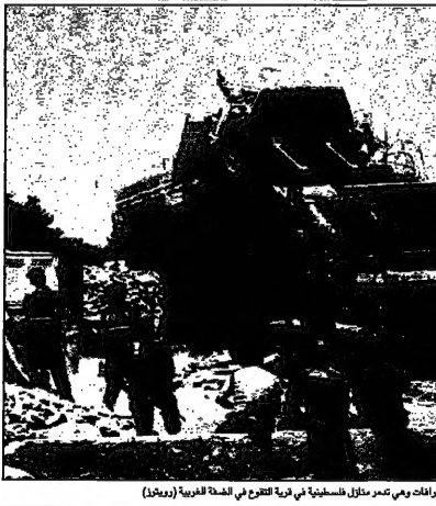
قوات الشرطة الاسرائيلية ترافق الجرافات وهي تعمر منزل فلسطينية في قرية العنك في الضفة الغربية (ريمان)

الف مواطنون يشاركون في تشييع فلسطيني قتله مستوطنان القدس - فلسطين العربية، اذ قد تم منح ترخيص لاذاعة المستوطنين، الف مواطنون يشاركون في تشييع فلسطيني قتله مستوطنان.